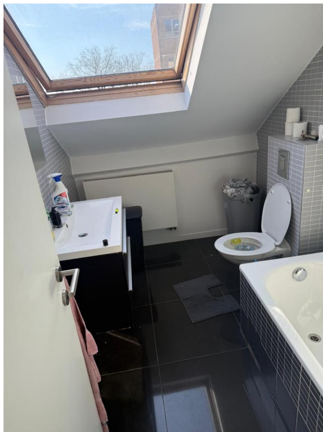
17. SDB 3ème étage