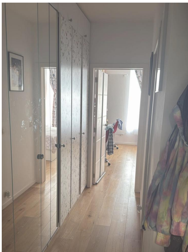
8. Couloir / placard