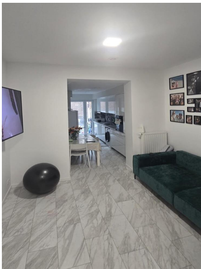
12. Salon / Salle à manger / cuisine 1er étage