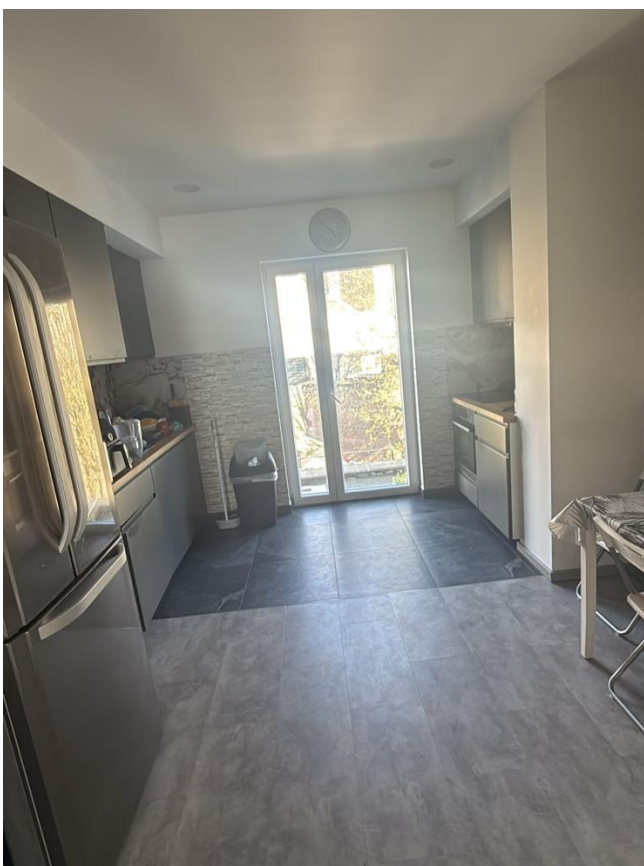
13. Cuisine 2ème étage