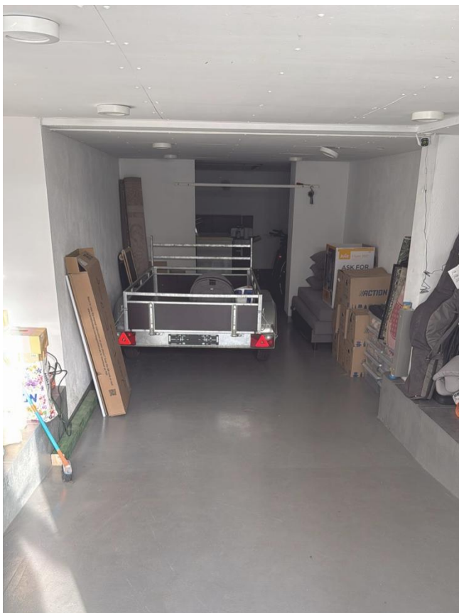
4. 5. Garage