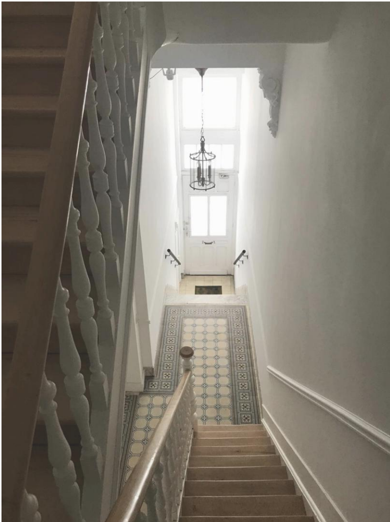
1. Vue de la cage d'escalier vers la porte d'entrée de l'immeuble