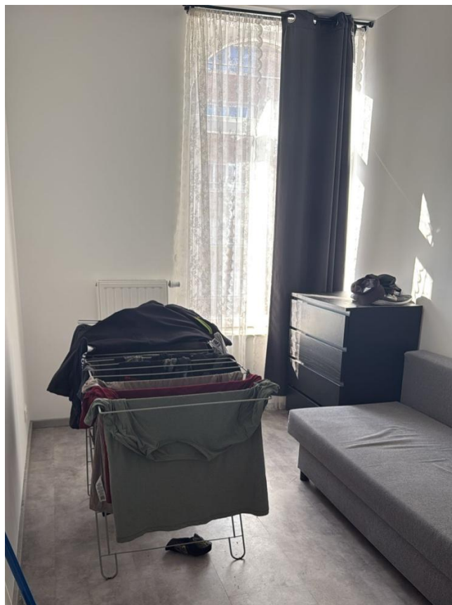
15. Coin bureau