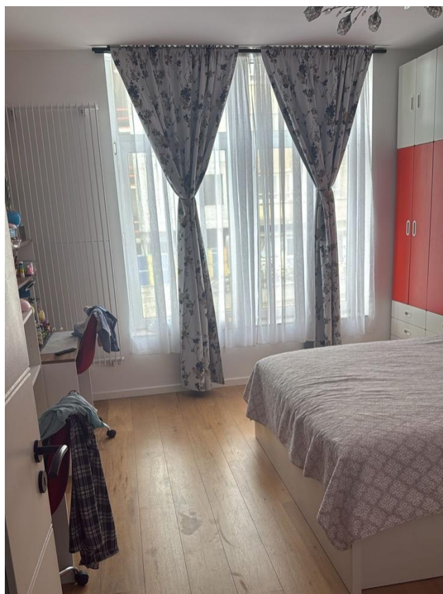
9. Chambre à coucher