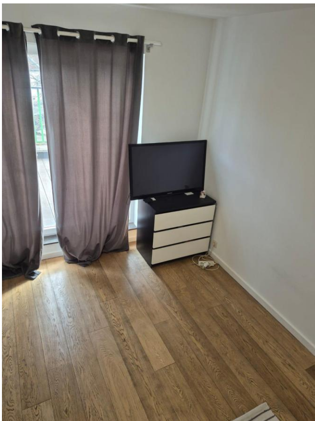
16. Chambre 3ème étage / lucarne régul.