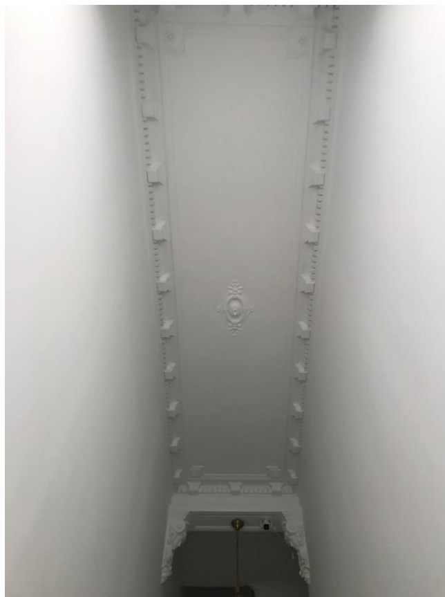
3. Plafond et moulures du hall d'entrée