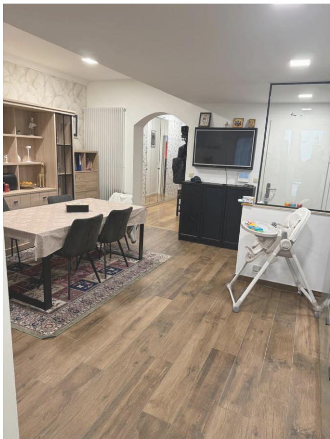
6. Salle à manger Bel-étage