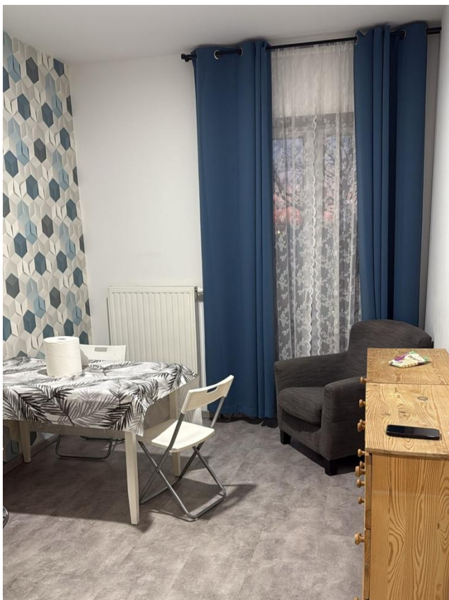
14. Coin séjour