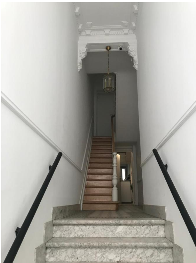
2. Cage d'escalier depuis l'entrée